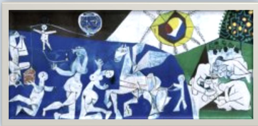
Πάμπλο Πικάσο (1952) « Ειρήνη και Πόλεμος»